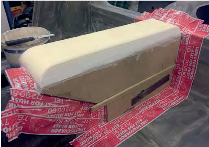
... sedan lite finlir på toppen ...