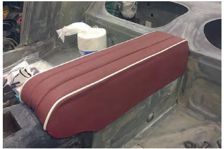
Och med pyjamasen på blev det som jag ville ha det! Allt kladdande får till slut sin belöning!