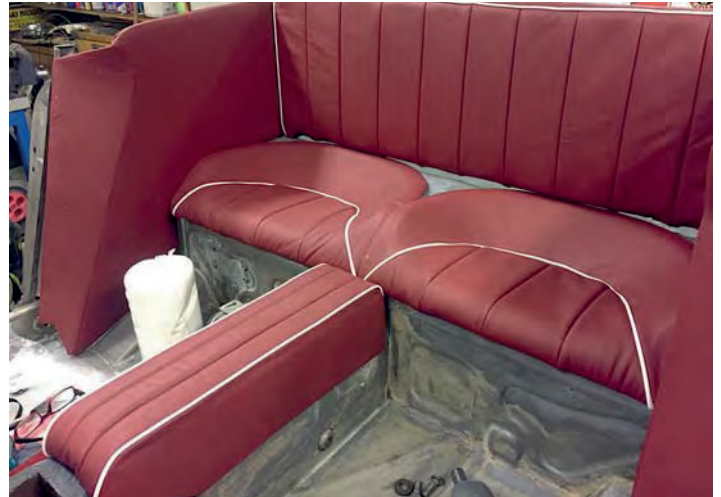
Hela bakre inredningen provmonterad. Det är vid såna här tillfällen man verkligen får drivkraften att arbeta på, sugen att se det helt färdigt!