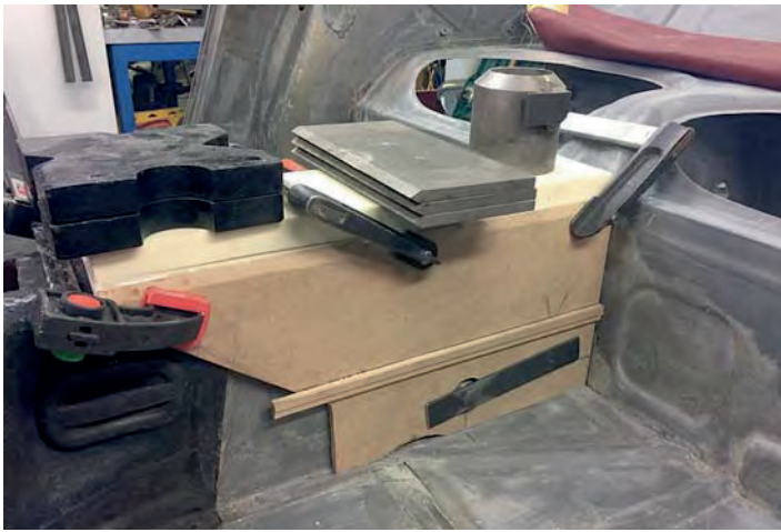
Tillverkning av plugg till nytt armstöd. Först lite snickarjobb ...