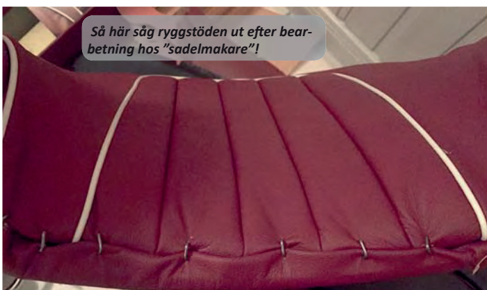
Så här såg ryggstöden ut efter bearbetning hos "sadelmakare"!

De bakre sidorna vid baksätet, gjordes också i 3 mm björkplywood, men med originalplåtarna mot B-stolparna som start. Där hade jag en NOS (New Old Stock) och en avkapad p.g.a. rost. Bara att kopiera och spegelvända. Plåt och plywood sitter samman med hjälp av s.k. "jungfruben" (kuvertklämmor).