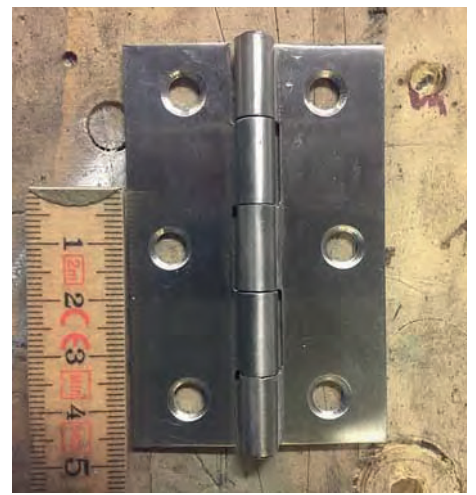
Ovan: köpta standardgångjärn för ryggstöde bak. Nedan: efter bearbetning och anpassning.