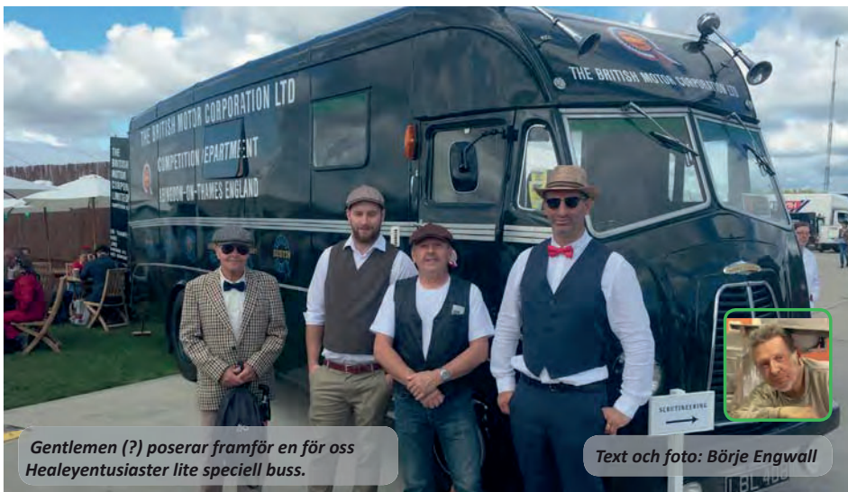
Gentlemen (?) poserar framför en för oss Healeyentusiaster lite speciell buss.