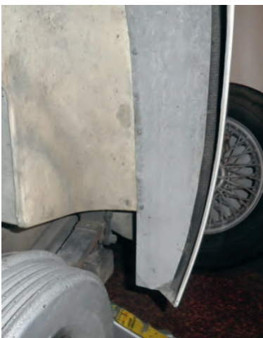
Gummlisten. Art nr 1-411 hos Örebro Agenturaffär.